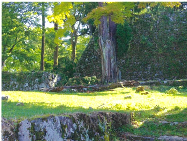
高取城二の丸付近(2)