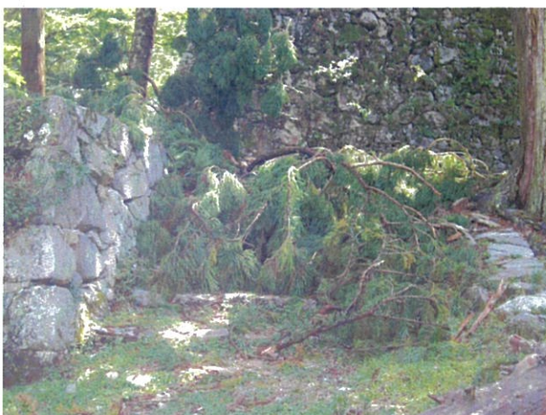
高取城二の丸付近(4)