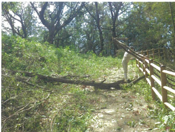
新沢千塚 272 号墳付近