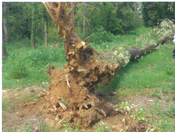
新沢千塚 289 号墳