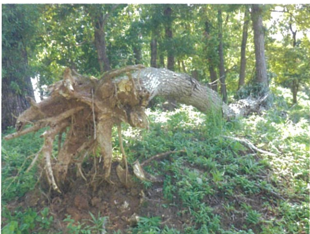
新沢千塚 289 号墳