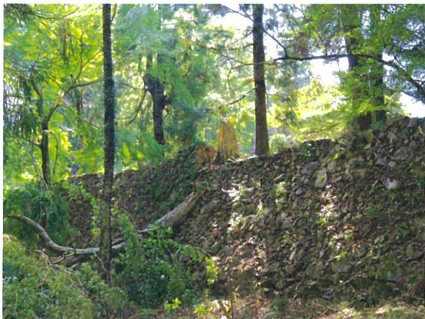
高取城二の丸付近(1)