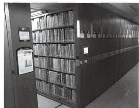
現在、一階集密書架に配架中

協会図書は今後も継続して寄贈を受けることとなっています。それにより全国の報告書はもとより、入手しにくい各地の同人誌的な雑誌が今後も揃うこととなります。日本は世界屈指の発掘調査量を誇り、考古学の成果はきわめて膨大です。本学図書館が果たす役割は日本のみならず世界の考古学においても大きいといえるわけです。