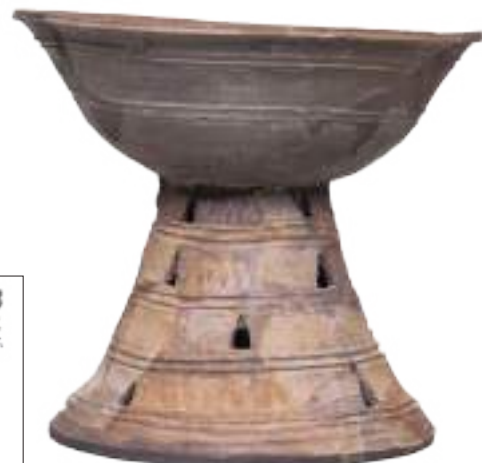
松江市石屋古墳出土須恵器器台 【松江市蔵】

事情により、各イベントを急遽中止する場合があります。あらかじめご了承ください。最新の情報は、当館公式ホームページ、Facebookなどをご確認ください。月の宴開催時は駐車場が大変混みあいます。ぜひ、公共交通機関をご利用ください。