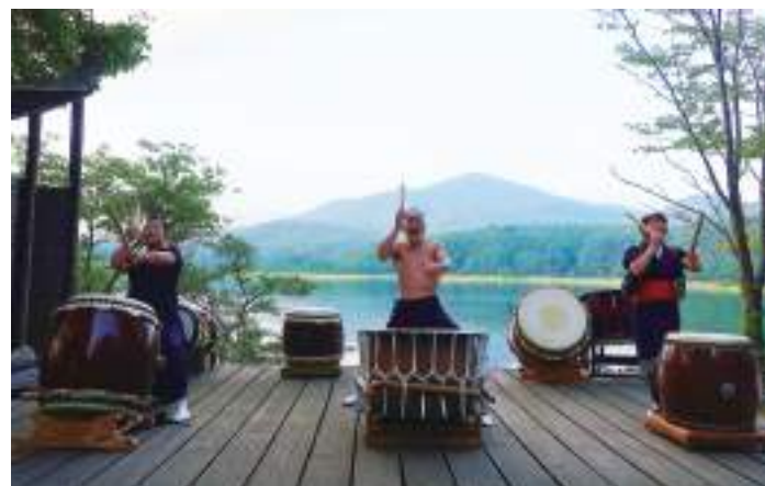
今福座・過去の演奏の様子