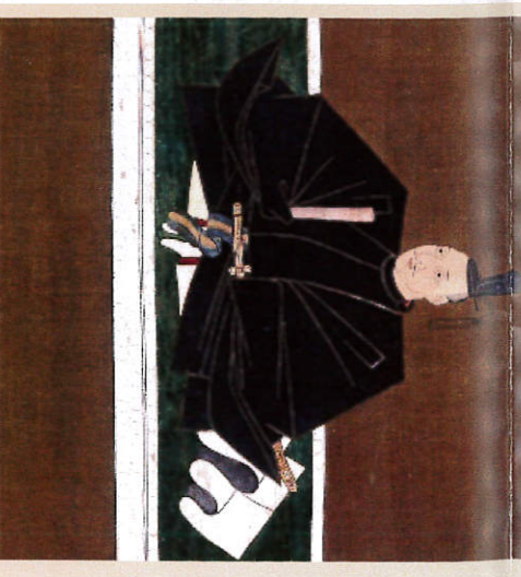
織田信長画像 寛古堂宗陳 天正11年(1583)