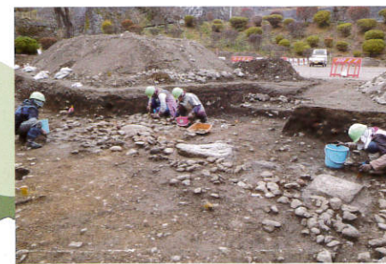
もりおかじょうあと 国指定史跡 盛岡城跡 (内丸)