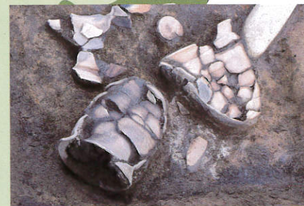
にしかど 西鹿渡遺跡 (三本柳)