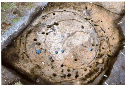
こやま 小山遺跡 (東中野)