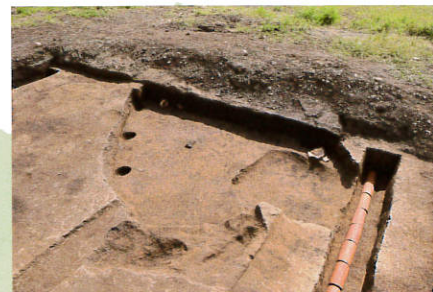
だいたろう 台太郎遺跡 (向中野)