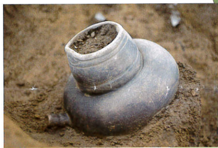
たがい 田貝遺跡 (上鹿妻)