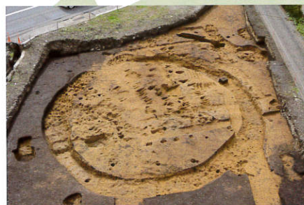
しもながばやし 下永林遺跡 (津志田)