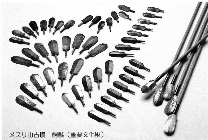
メスリ山古墳 銅鏃 (重要文化財)

今回の展覧会では、古墳時代の武器にスポットライトをあてます。本来の姿を正確に復元した「ひかり輝く」武器を交え、奈良県内の古墳出土資料から、その種類、使い方、身に着け方、武装の流行の変化など、武器・武具発展の歴史を紹介します。