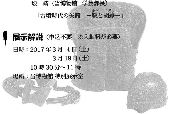
新沢 115 号墳 甲冑

日時：2017年3月4日(土) 3月18日(土) 10時30分～11時 場所：当博物館 特別展示室