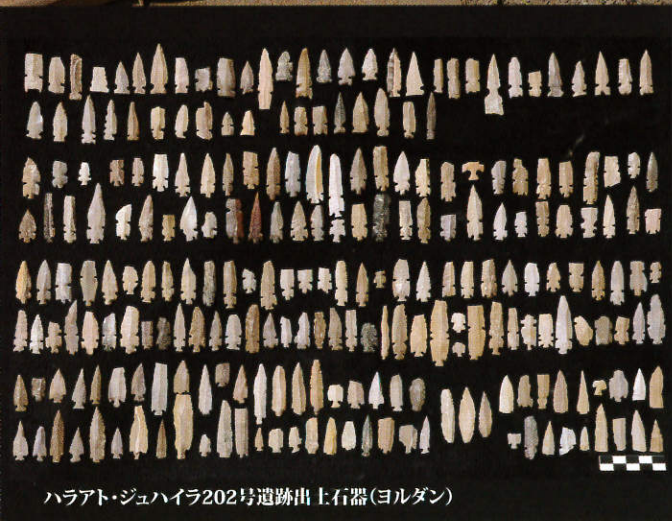
ハラアト・ジュハイラ202号遺跡出土石器(ヨルダン)