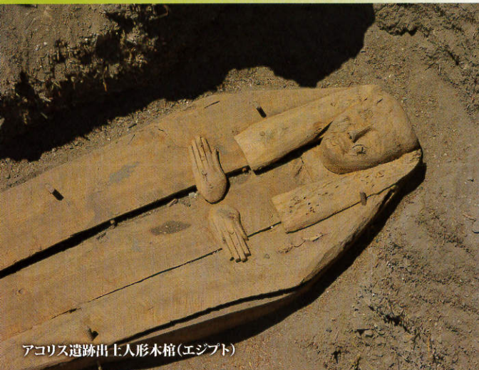
アクリス遺跡出土人形木棺(エジプト)