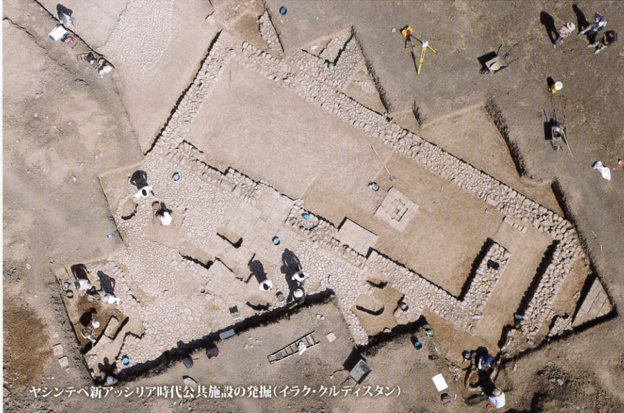
ヤシントヘ新アッシリア時代公共施設の発掘(イラク・クルディスタン)

The 24th Annual Meeting of Excavations in West Asia