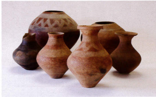
弥生土器 都立田園調布高等学校内遺跡出土(当館蔵)