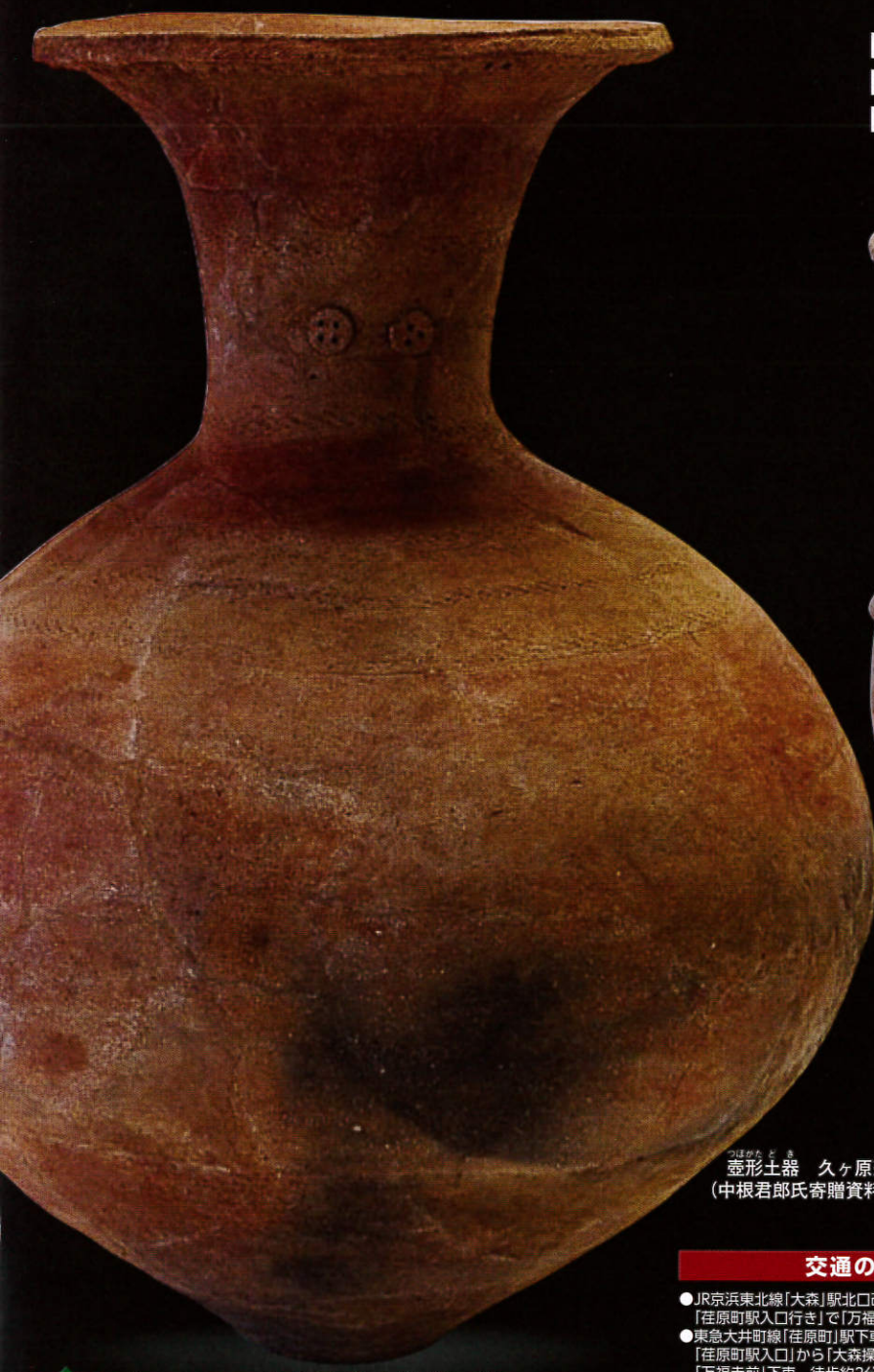
つぼかたどき 壺形土器 久ヶ原遺跡出土 (中根君郎氏寄贈資料・当館蔵)