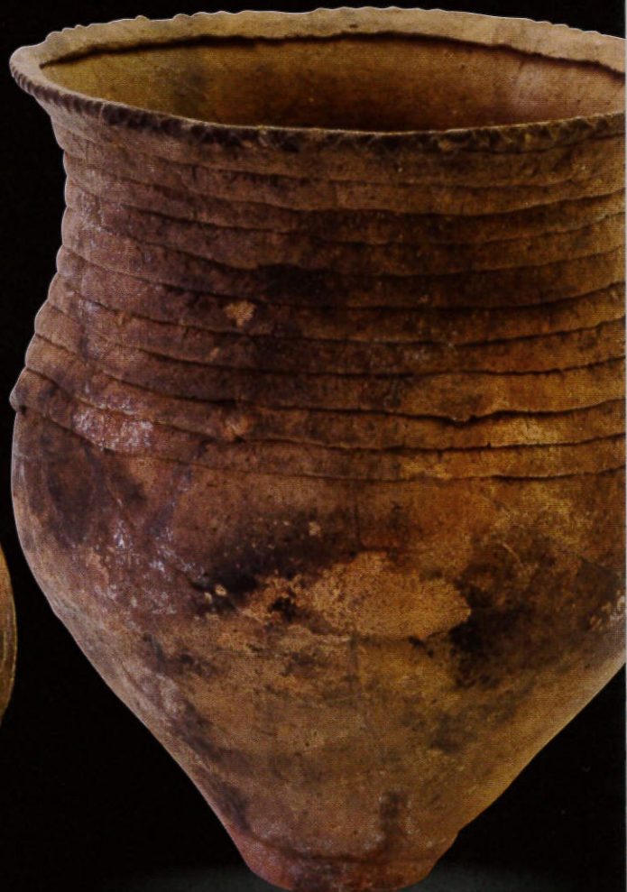
かめかたどき 甕形土器 久ヶ原遺跡出土 (中根君郎氏寄贈資料・当館蔵)