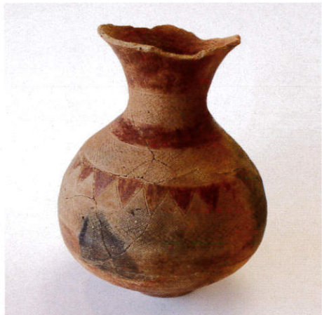
壺形土器 久ヶ原遺跡出土(当館蔵)