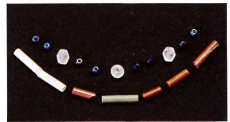
玉類 都立田園調布高等学校内遺跡出土(当館蔵)