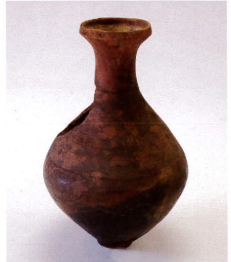
壺形土器 山王遺跡出土(当館蔵)