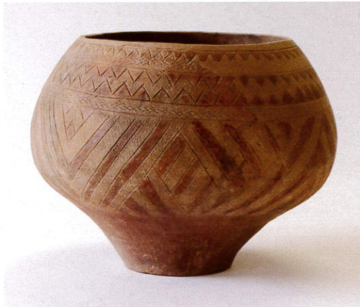
幾何学文壺 久ヶ原遺跡出土(当館蔵)