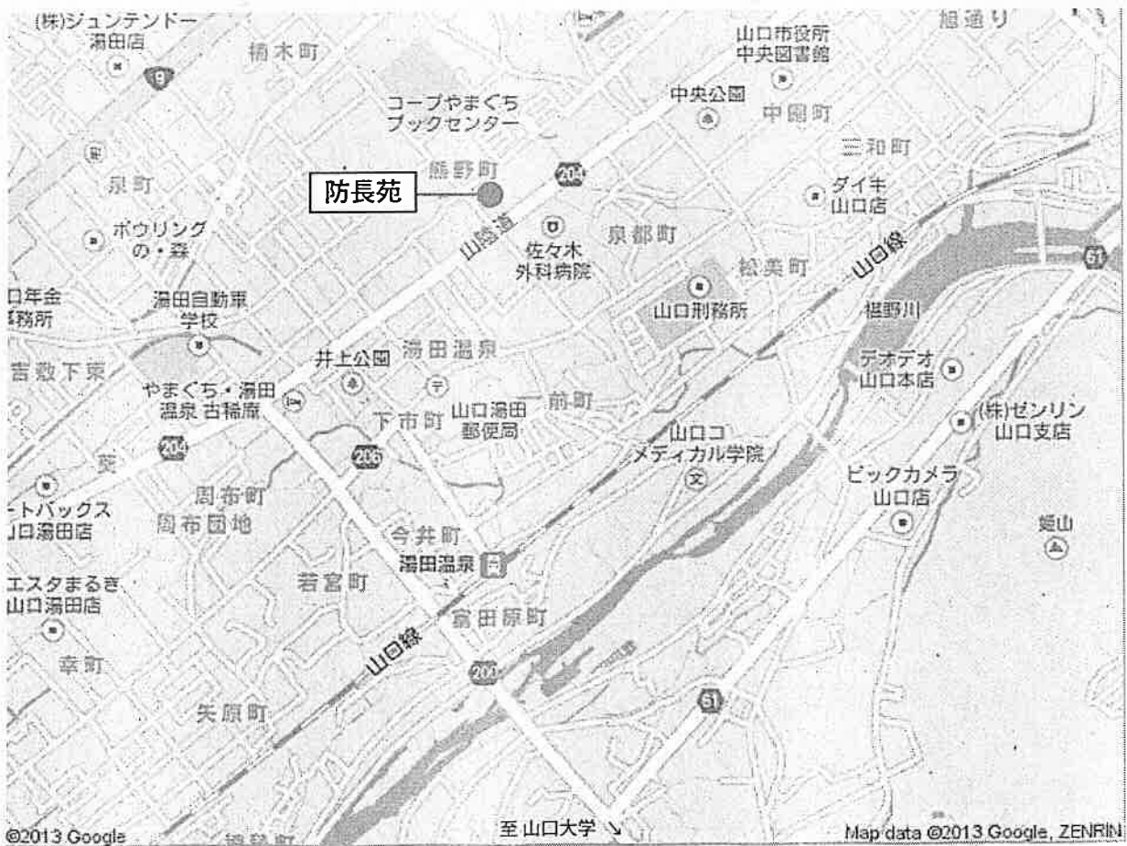
防長苑(懇親会会場)地図