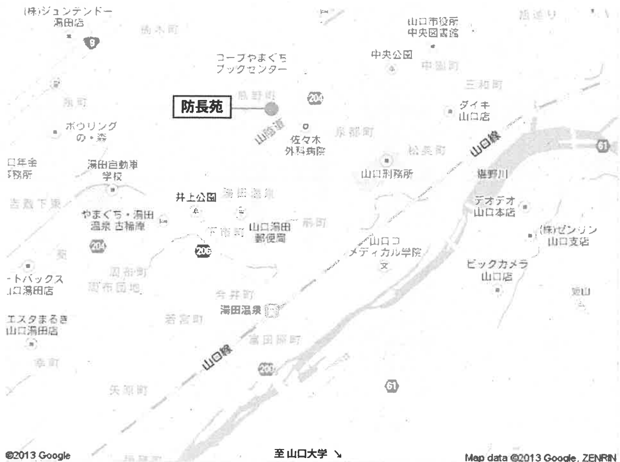
防長苑（懇親会会場）地図