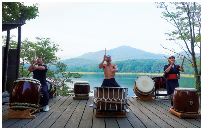
今福座・過去の演奏の様子

事情により、各イベントを急遽中止する場合があります。あらかじめご了承ください。最新の情報は、当館公式ホームページ、Facebookなどをご確認ください。月の宴開催時は駐車場が大変混みあいます。ぜひ、公共交通機関をご利用ください。