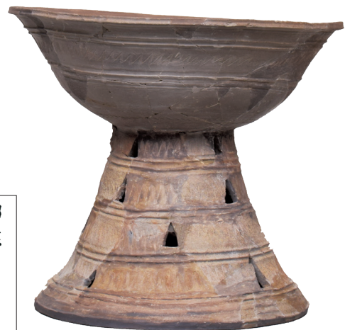
松江市石屋古墳出土須恵器器台 【松江市蔵】